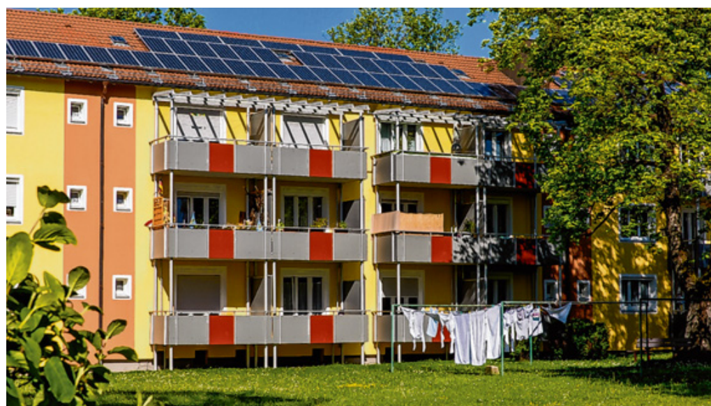
Die Baugenossenschaft hat viele ihrer Wohnungen modernisiert, wie hier in der Thermenstraße.