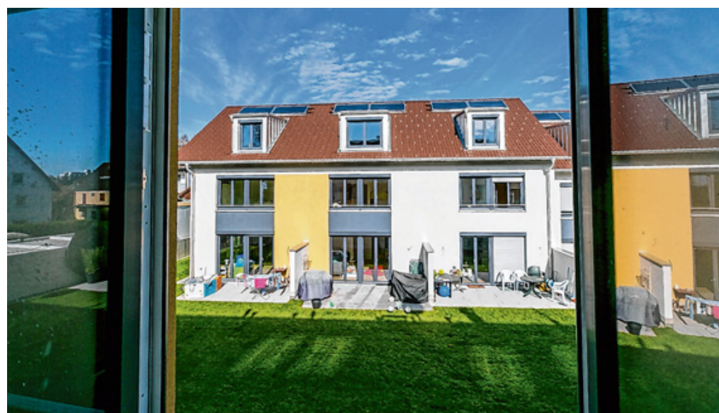
Familiengerechtes Wohnen: Die neuen Reihenhäuser der BSG an der Wilhelmstraße.