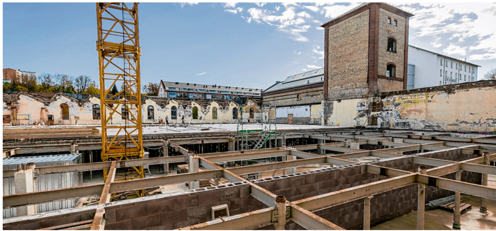
Moderne Trend-Mietwohnungen errichtet die Sozialbau derzeit in den Sheddachhallen der ehemaligen Spinnerei und Weberei in der Kesselstraße.